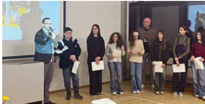
Jahresempfang Februar 2026, die neuen Schulsanitäter werden geehrt und ins Amt berufen.

Zuckerfabrik 7 70376 Stuttgart Telefon: 0711/2 22 67 67 Telefax: 0711/2 22 67 68 info@lessing-schulen.de www.lessing-schulen.de