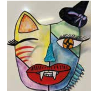
Kunst im Schulhaus, inspiriert vom Karneval in Venedig.