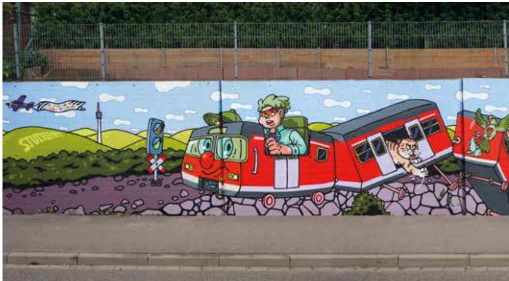
Urbane Kunst an der Haltestelle Züricher Straße von Moner/Horst

Ihre Stadtteilzeitung für den Hallschlag und Umgebung